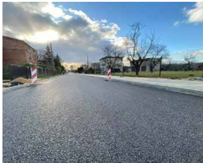
Ulica Brzeziny po remoncie

energii: kolektor słoneczny i panele fotowoltaiczne. Koszty realizacji inwestycji zostały poniesione ze środków pochodzących z Funduszy Europejskich (ponad 312 tys. zł) oraz ze środków Górnośląsko-Zagłębiowskiej Metropolii w ramach „Programu działań na rzecz ograniczenia niskiej emisji w 2020 roku” (ponad 198 tys. zł). Jako burmistrz Wojkowic staram się każdego dnia udowodniać, że nie ma dla mnie zapomnianych miejsc w mieście i mam nadzieję, że ta inwestycja to potwierdza – komentuje zakończony remont burmistrz miasta.