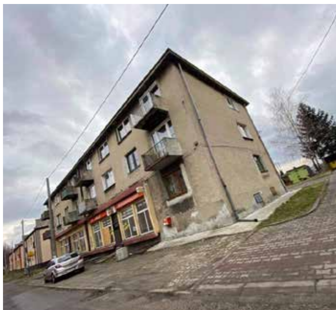
Budynek przy ulicy Sucharskiego przed remontem