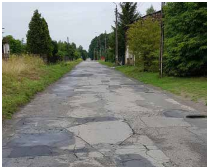
Ulica Brzeziny przed remontem