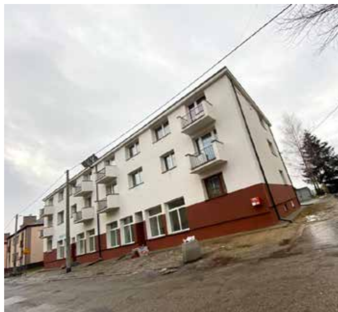
Budynek przy ulicy Sucharskiego po remoncie