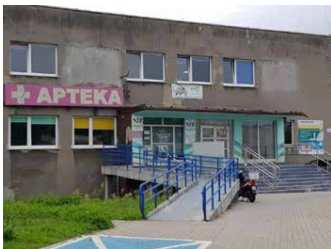
Budynek ZOZ Wojkowice przed remontem

Kolejną termomodernizację przeprowadzono w budynku przy ulicy Sucharskiego 17 i 17a. W ramach projektu wymieniona została stolarka okienna i drzwiowa, ocieplono stropodach, ściany zewnętrzne oraz fundamentowe. Zmodernizowano również instalację elektryczną oraz wyposażono budynek w urządzenia wykorzystujące odnawialne źródła