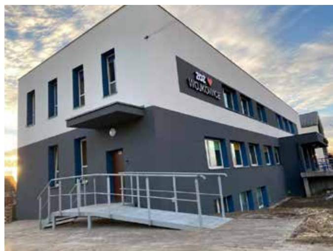
Budynek ZOZ Wojkowice po remoncie